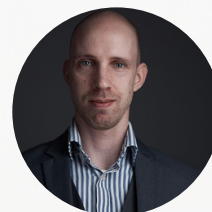
RAIS MENSE Dossier Monitoring & Ethisch Hacker